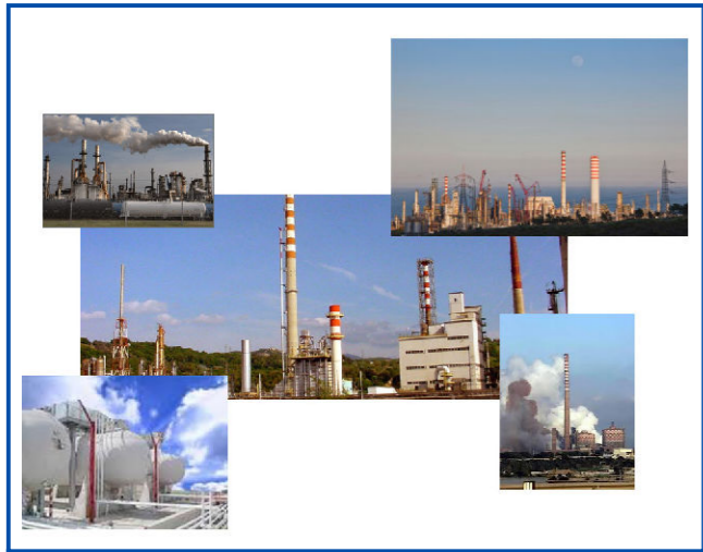
Tavola 5 Ubicazione stabilimenti RIR - Depositi Gas liquefatti